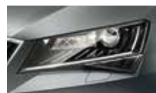
Smart Light Assist – automatické přepínání a clonění dálkových světel