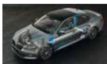
Adaptivní podvozek – volitelné nastavení podvozku ve 3 režimech (Comfort, Normal, Sport)

ŠKODA usnadňuje život svým zákazníkům každý den.