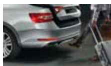
Virtuální pedál – bezdotykové otevírání 5. dveří